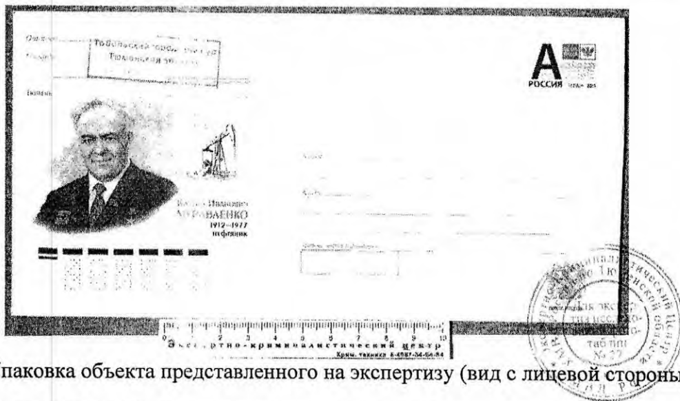
Фото № 1. Упаковка объекта представленного на экспертизу (вид с лицевой стороны).