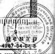
Фото № 3 Фрагмент бумаги розового цвета размерами 83x89мм с цифровыми записями представленный на экспертизу.

1 2 3 4 5 6 7 8 квартно-криминалистический центр Крим. техника 8-4967-54-04-8